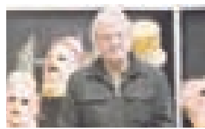
Cirque du Soleil Buscando talentos por todo el planeta

Las compañías abordan nuevas fórmulas para gestionar el talento