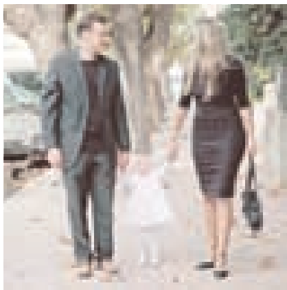
Conciliación trabajo y familia Flexibiliza y vencerás